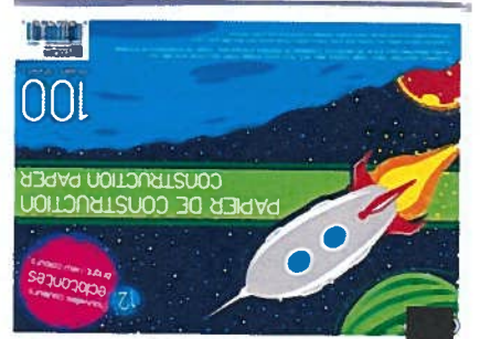
Pochette avec papier de construction