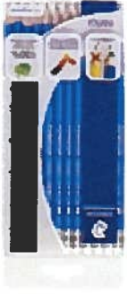
Crayons à mine