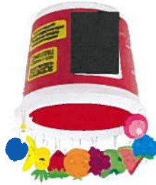
Pâte à modeler 250g