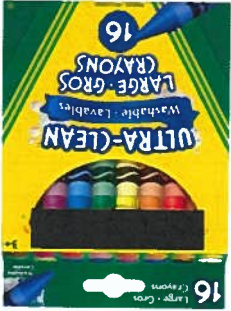
Crayons de cire